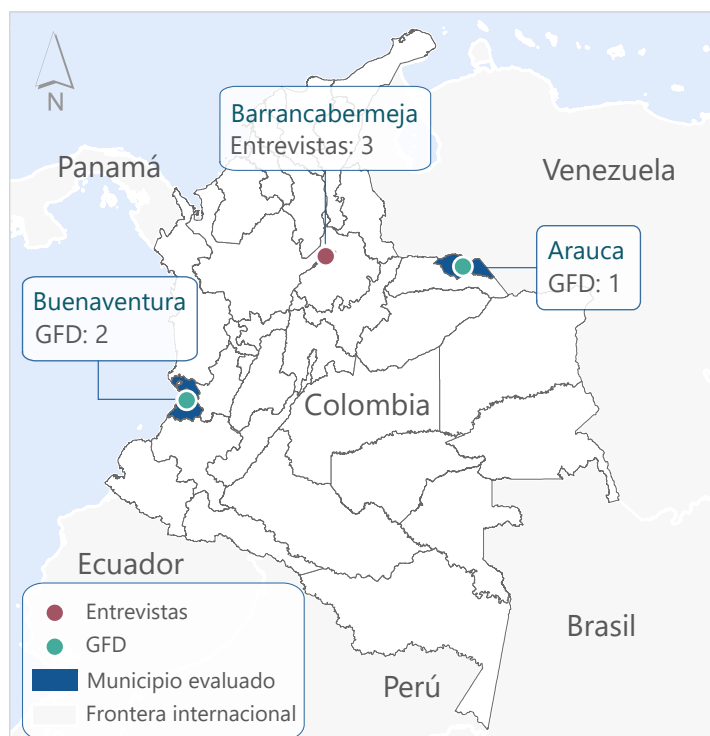
Mapa de cobertura de la evaluación

las entrevistas para entender el crecimiento de los emprendimientos se encontró el posicionamiento del negocio a partir de la visibilidad de la marca , por ejemplo, en Arauca una de las emprendedoras utilizó su transferencia para incluir en sus prendas de lencería la marquilla del negocio de forma que ganara visibilidad entre su clientela sin perder la línea estética del producto. También, se reportó la reducción de gastos debido a un mejor manejo de la contabilidad, y trasladar los negocios a locales independientes con mejores condiciones para la atención al cliente.