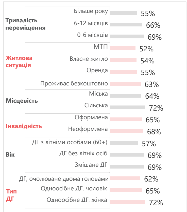
Рисунок 1. Частка переміщених домогосподарств з крайнім або крайнім+ балом ССІА, за індивідуальними характеристиками (n=8919)