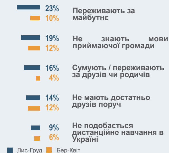
Графік 3: Основні ризики безпеки та благополуччя для дітей та підлітків, як повідомляють опікуни ▼

«Немає проблем» повідомили 41% опікунів наприкінці 202 та 51% на початку 2023.