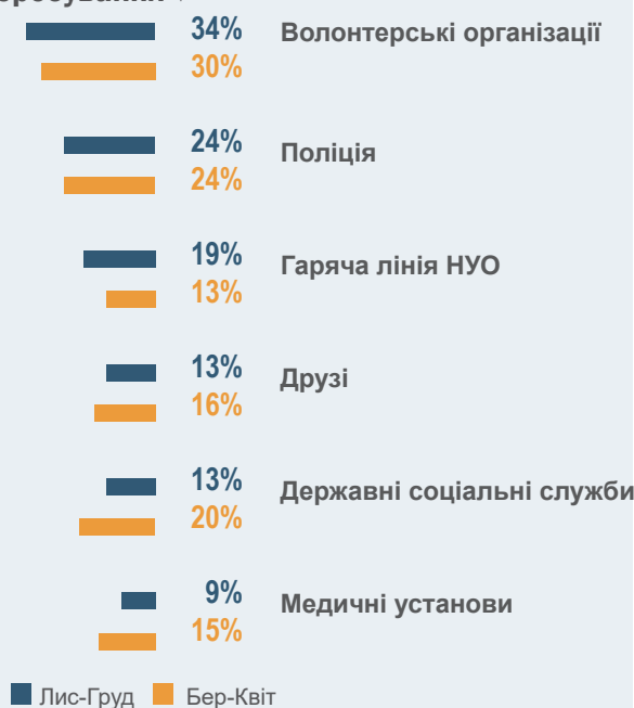
Графік 4: Основні надійні захисні фактори, про які повідомляють опікуни в країні перебування ▼

▼ Респонденти могли обрати декілька варіантів.