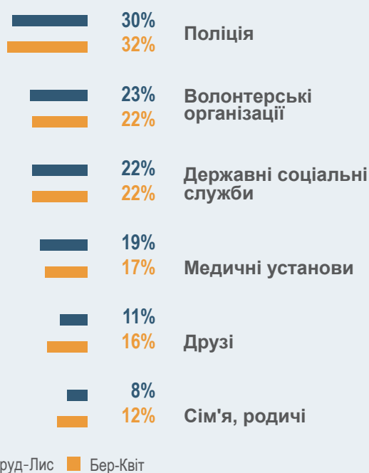
Графік 3: Основні надійні захисні фактори, про які повідомляють опікуни в країні перебування ▼

Діти та підлітки також пояснили, що їм подобається проводити дозвілля з родиною, наприклад, відвідувати музеї та бути на природі.