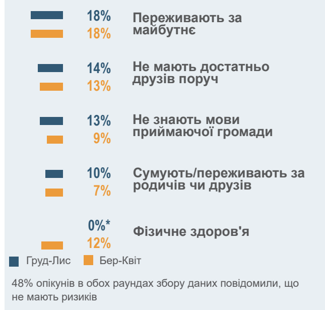
Графік 2: Основні ризики безпеки та благополуччя для дітей та підлітків, як повідомляють опікуни †